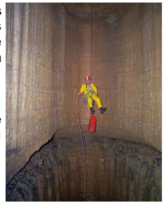
Gouffre de la Sonnette

Au cours de cette balade, nous vous expliquerons la géologie du Perthois et de son massif karstique, ainsi que l'action de l'eau qui est à l'origine de la formation des grottes et des gouffres.