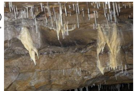
Concrétions (draperies et fistuleuses)