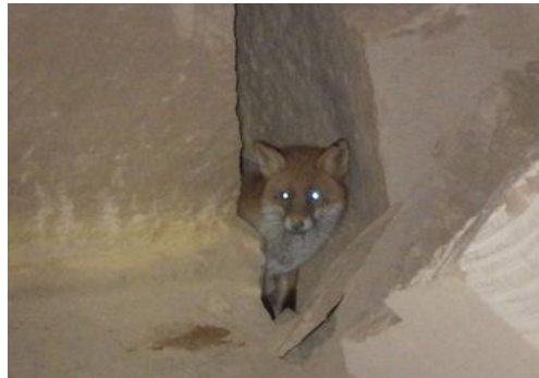
Une de nos rencontre occasionnelle

Si nous avons de la chance, nous pourrions également voir des crustacés cavernicoles ainsi que des chauve-souris et toute une autre faune.