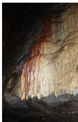
Concrétions (draperies teintées d'oxyde de fer)