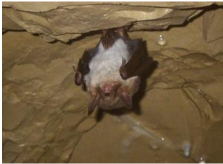
Chauve souris (grand murin)

Si nous avons de la chance, nous pourrions également voir des crustacés cavernicoles ainsi que des chauve-souris et toute une autre faune.