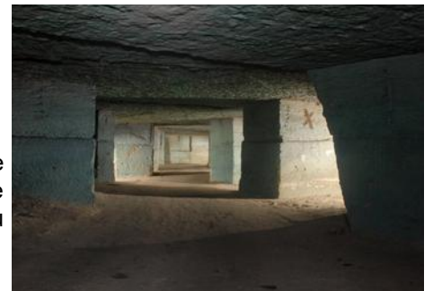
Anciennes champignonnières (les salles bleues)

Nous vous expliquerons l'histoire des carrières avec l'extraction de la pierre à travers les âges, puis la culture du champignon de Paris.