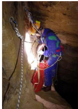
Gouffre du Cornuant

Vous verrez l'entrée du gouffre de la Sonnette qui est un des gouffres les plus profonds du département.